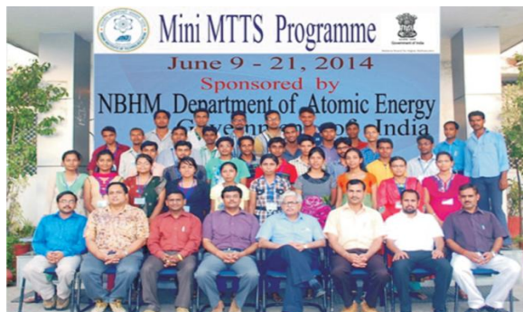
Participants of Mini MTTs Programme with the Resource Persons