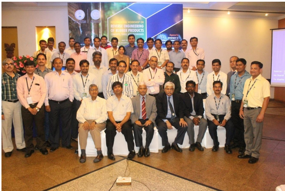
A group photo of participants at IWRERP 2014

conference. There were interesting sessions on Polymer Composites and Nanocomposites, Polymer Blends, Polymer Processing, Carbon and Smart Materials, Advanced Analytical Characterization Techniques, Tyre, Sustainability, Recycling and Regulation, New Polymers and Filters, Strategic Materials, Textile Materials, Rubber Products, Polymer Synthesis and Characterization and Modeling and Simulation. The technical part of this conference was composed of approximately 18 invited lectures and 78 contributory lectures. There were eminent speakers and delegates from USA, Germany, Austria, South Korea, Srilanka and Japan.