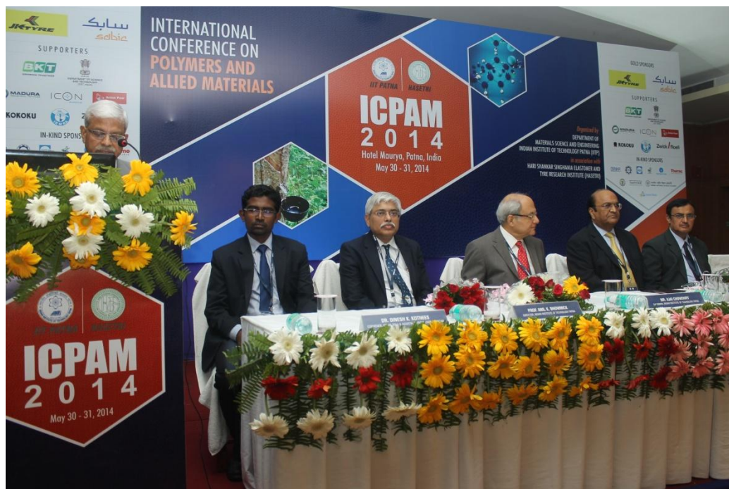
Delegates on the Dais at ICPAM 2014