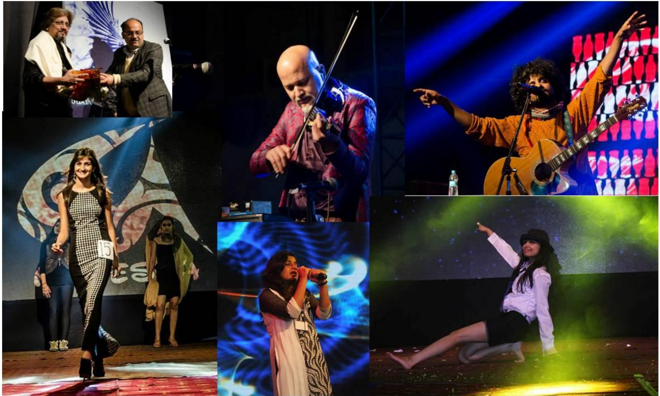
Glimpses of Anwasha 2015