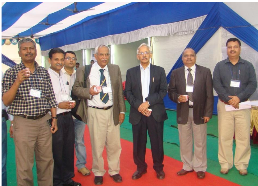
Participants of IOQO 2014 during High Tea