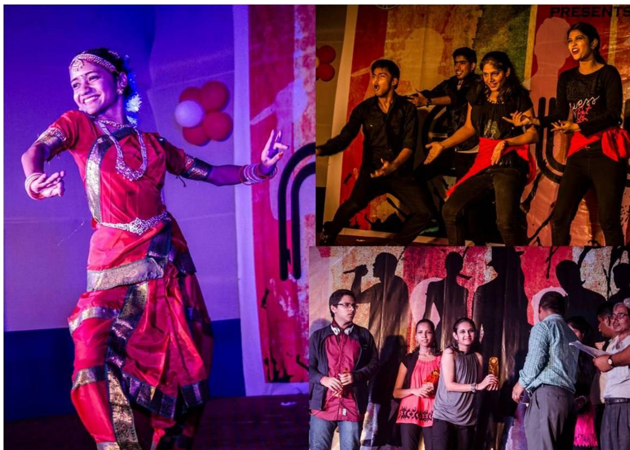
Glimpses of Nebula 2014 held at IIT Patna