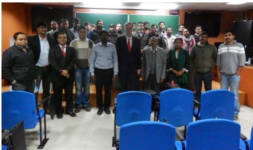
Participants at the half day seminar on Trends and Innovations in Materials Testing for Academia held at IIT Patna